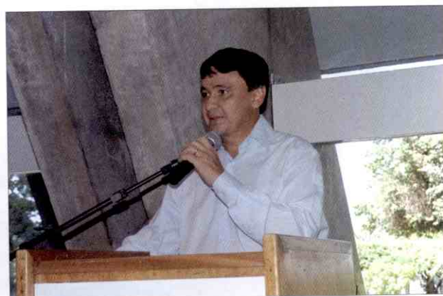
Governador Wellington Dias