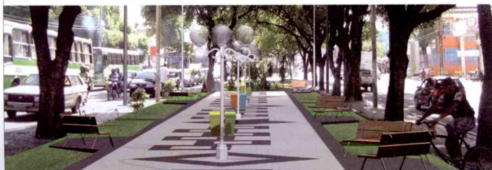
Mudanças facilitarão trânsito de pessoas e carros