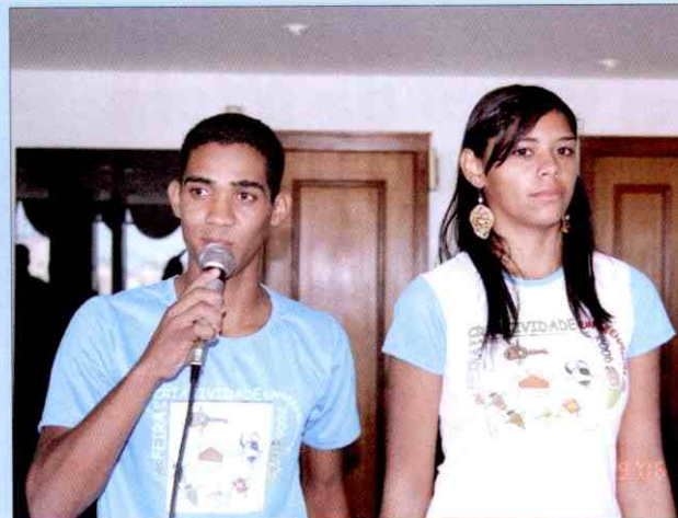
Jovens beneficiados pelo Consócio Social

Lideranças empresariais, lojistas e representantes de entidades ligadas ao comércio estiveram reunidos com o ministro do Trabalho e Emprego, Luis Marinho, num almoço promovido pela Câmara de Dirigentes Lojistas de Teresina (CDL). Na oportunidade, foram discutidas questões ligadas ao setor, principalmente no que diz respeito à reforma das leis trabalhistas e à geração de emprego.