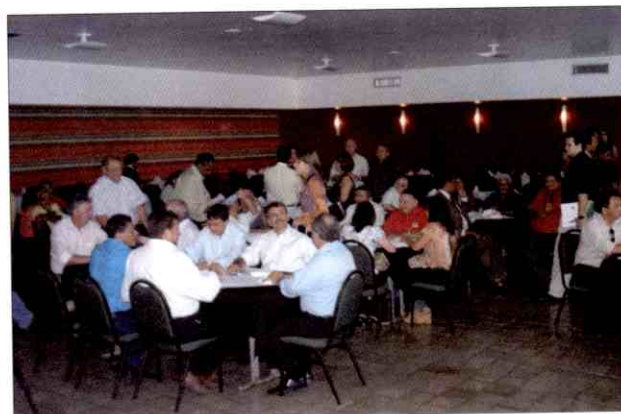
Lojistas e autoridades reunidos