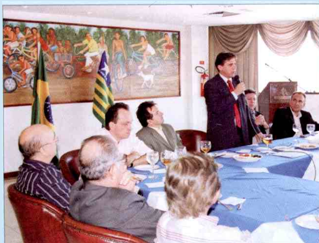
Lojistas escutam atentamente