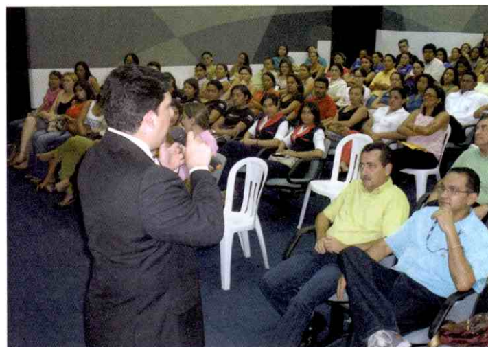
Novas ferramentas de crédito foram apresentadas