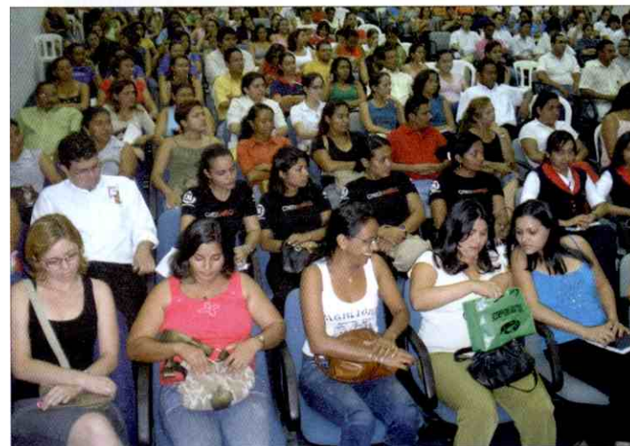
Participação expressiva do público