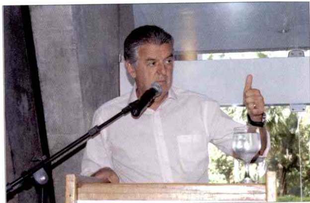
Ministro do Turismo Walfrido Mares Guia

Em sua sétima visita ao Piauí, todas as atividades voltadas para o Turismo, o ministro Walfrido Guia afirmou que esta é uma das áreas mais importantes do setor de serviços. "Investir na promoção do turismo é tão importante quanto investir em obras", enfatizou. "Todas essas reivindicações serão analisadas e buscaremos dar a vocês condições necessárias para o desenvolvimento desse Estado", declarou.