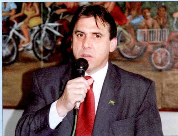
Ministro do Trabalho Luis Marinho